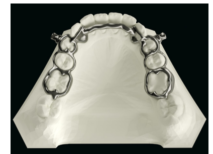
UK Herbst mit Lingualverbinder (anliegend oder abstehend) UK Herbst with lingual connector (abutting or protruding)