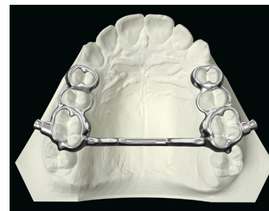
OK Herbst mit Transpalatinalbügel OK Herbst with Transpalatal bracket