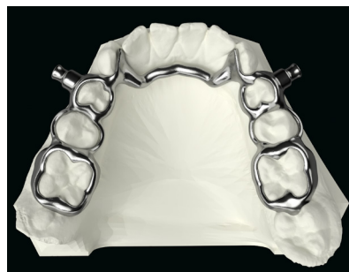
UK Herbst mit Lingualverbinder (Cervikalsaum verlaufend) UK Herbst with lingual connector (cervical hem running)