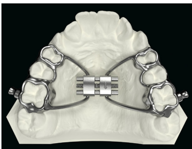
OK Herbst mit Dehnschraube OK Herbst with expansion screw