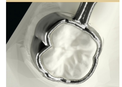
Molarband ohne okklusale Abstützung Molar band without occlusal stop