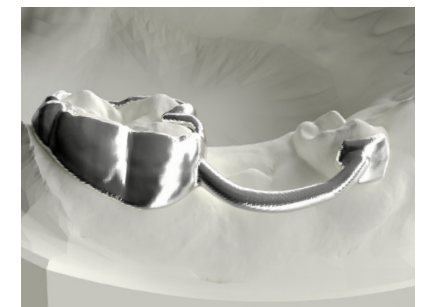
Mit einzelmem bukkalem Distanzarm With single buccal spacer arm