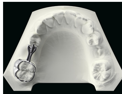
Spac3R direkt Spac3R direct