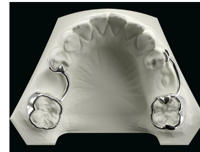
Zwei mögliche Teilbänder für die Prämolaren Two possible partial strips for the premolars

We can work with you to develop your own custom design. A design that is developed specifically for you and your workflow. You can see two possible examples below.