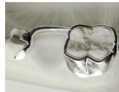
Mit einzelmem ligualem Distanzarm With single ligual spacer arm