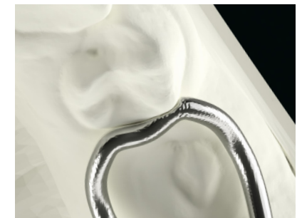
Ohne okklusale Abstützung Without occlusal stop