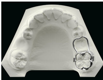
Spac3R indirekt Spac3R indirect