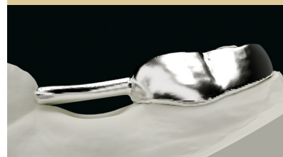
Abstand zum Zahnfleisch Distance to the gum

Sie können Auflager zur okklusalen Abstützung auf den Zähnen frei wählen. Die Kombinationen zwischen V 1, V 2 und den okklusalen Abstützungen sind individuell anpassbar.